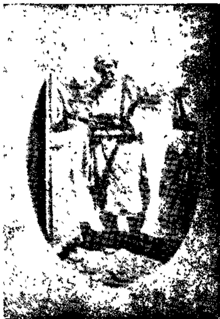
( سام خان فرزند زائر خضر خان )

سام قتل کرد، سام متعجب شده گفت خوب شد که این خائن از اینجا