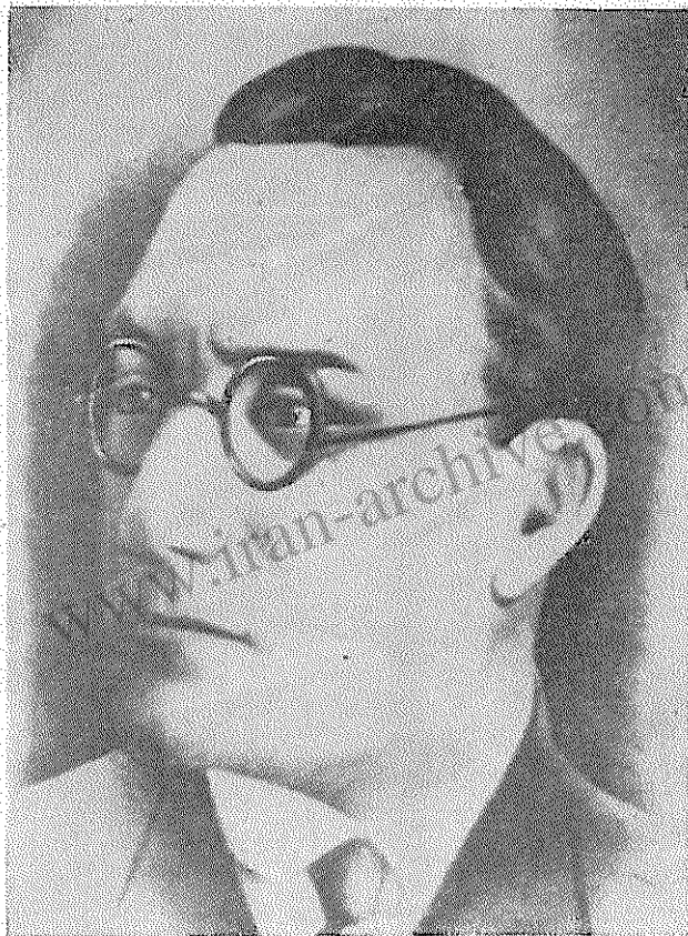
رهبر شهید زحمتکشان ایران دکتر تقی ارانی مروج بزرگ مارکسیسم - لنینیسم