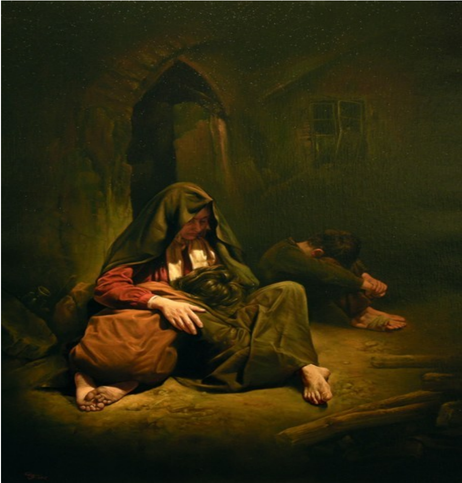
یا رب. در کسوت عابدان آبرومند، زنان